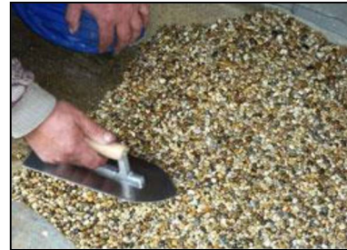
kapitola I.8 níže.